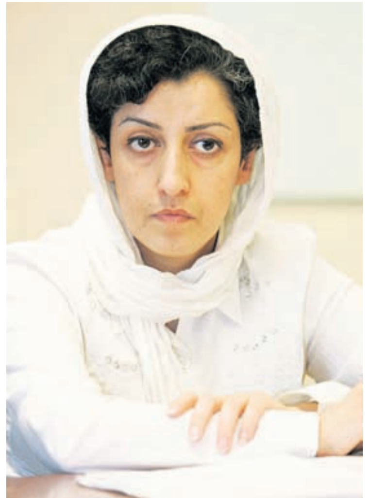
Su detencion ta ilustra falta di tolerancia pa activismo pa- sivo y civil, di parti di autoridad Irani", el a bisa. □

Mahmood Amiry-Moghadam di e grupo basa na Norwega Iran Human Rights, ta condena Mohammadi su detencion.